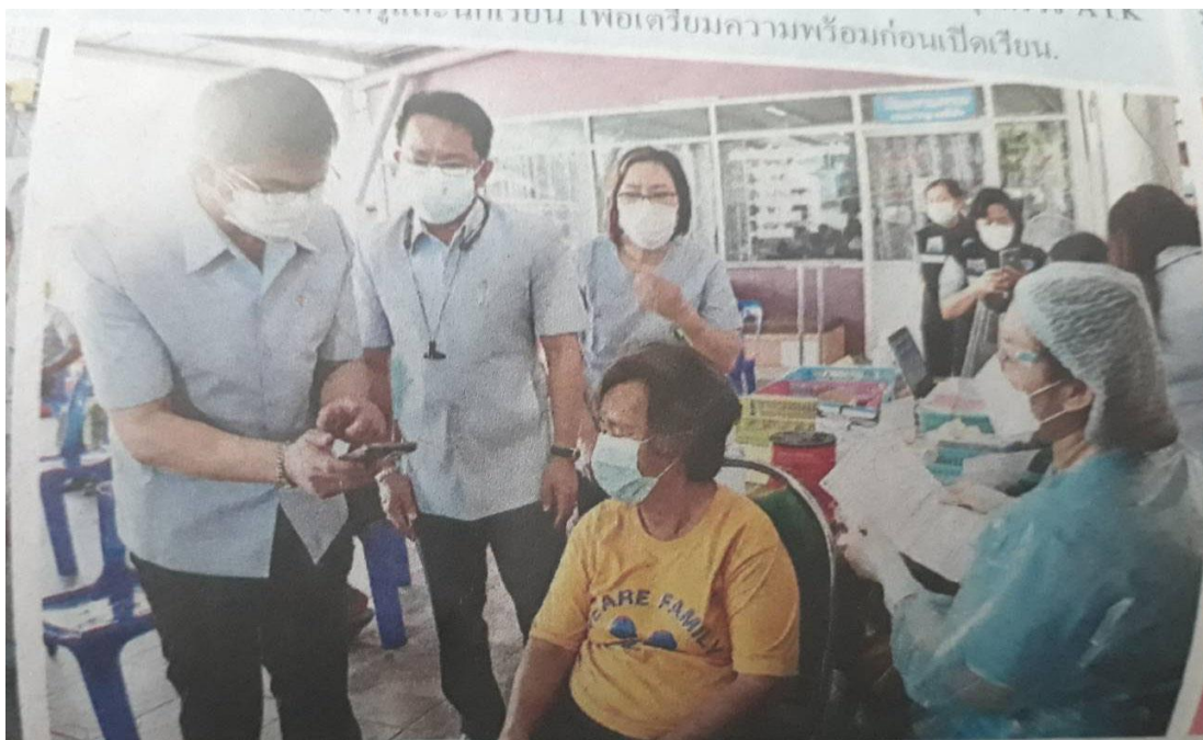
รณรงก์นิต นพ.ยุทธนา วรรณโพธิ์กลาง นพ.สสจ.พระนครศรีอยุธยา ลงพื้นที่ตรวจเยี่ยมให้กำลังใจ จนท.สสจ.พระนครศรีอยุธยา บริการฉีดวัคซีนแก่บุคคลทุกสัญชาติ และเยาวชนตั้งแต่ 18 ที่วัดพระเชตุพนวิมลมังคลาราม.